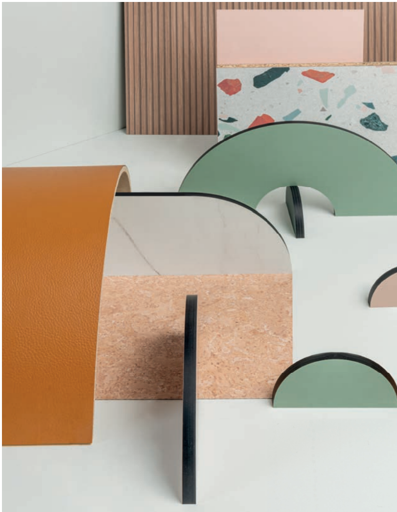
Beige Nude / Cork Natural / Kaki / Marbre de Paros / Ocre de Toscane / Rose Givré Terrazzo Venetian Pastel / Vert de Vosges / Vert Saugé