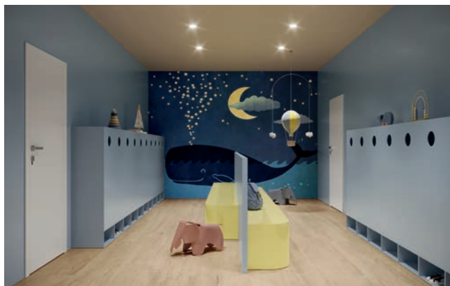
Blanc Artic / Bleu Poudré / Jaune Samra