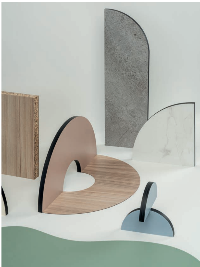
Beige Nude / Bleu Poudré / Dolmen / Marbre de Paros / Orme Élégant / Vert Sauge