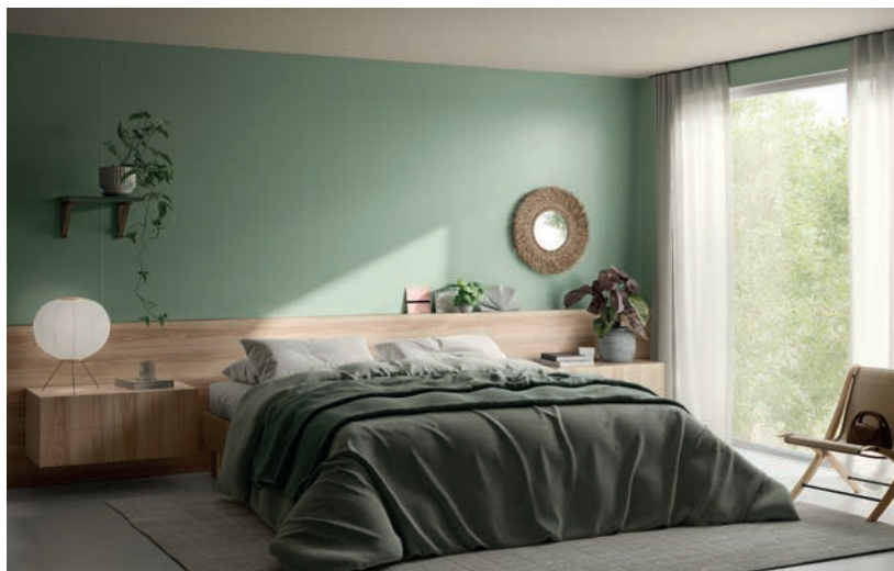
Ecru / Orme Élégant / Vert Sauge