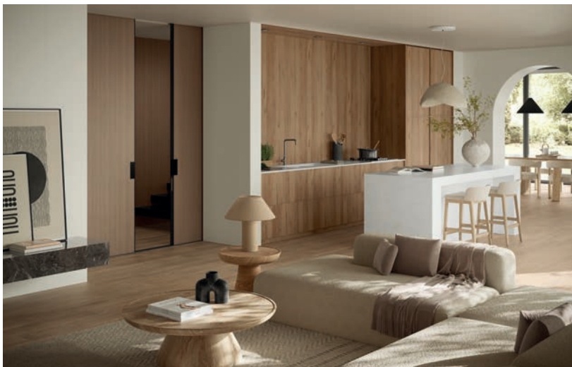
Chêne des Alpilles / Lamella Clair / Marbre Palazzo