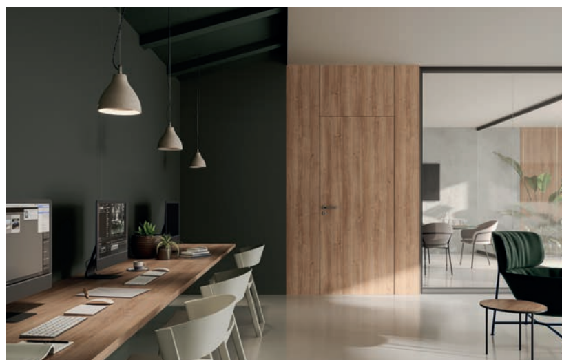
Blanc Artic / Chêne Zermatt / Élément / Vert des Vosges

(3) : 215 x 97 cm - 245 x 124 cm - 305 x 130/132 cm