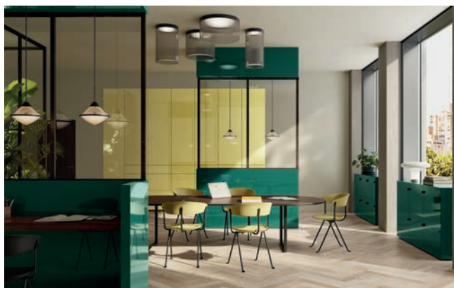
Citronnelle / Vert Sarcelle / Noyer Chesterfield