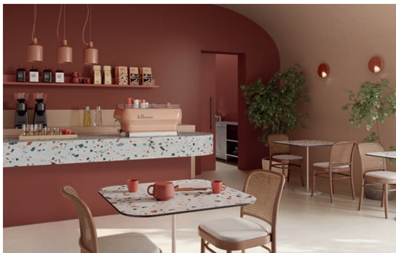
Brique / Beige Nude / Terrazzo Venetian Pastel